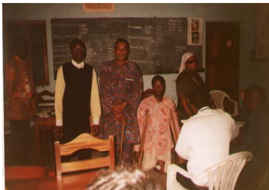
Membres de la nouvelle coordination diocésaine de Bukavu