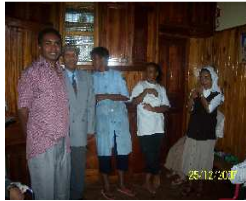
L'Aumônier, le Coordinateur national et quelques Sœurs accompagnatrices de la Fraternité de Madagascar