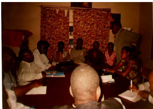
Nouvelle Equipe diocésaine et responsables des paroisses avec le Coordinateur du Congo-Est