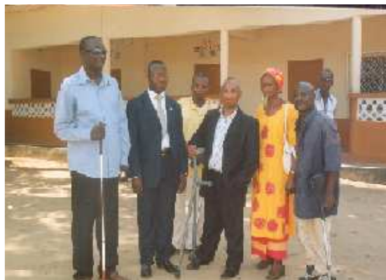
Le Coordinateur africain et les membres de l'équipe de coordination nationale de la Frater du Congo Brazzaville